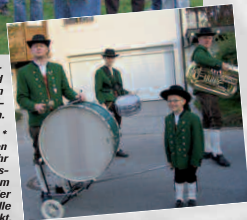
Am 1. Mai wurden schon um 6.30 Uhr die ersten Gunkskirchner mit einem Ständchen von der Musikkapelle geweckt.