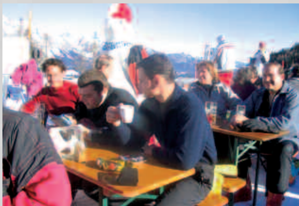
Bereits kurz nach Neujahr ging es zum alljährlichen Musiker-Schiausflug. Bei diesem herrlichen Wochenende in Schladming durfte natürlich auch der Einkehrschwung nicht fehlen.