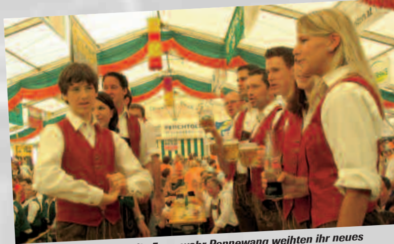
Die Musikkapelle und die Feuerwehr Pennewang weihen ihr neues Musik- und Feuerwehrhaus mit einem Zeltfest ein. Gunskirchen feierte natürlich mit.