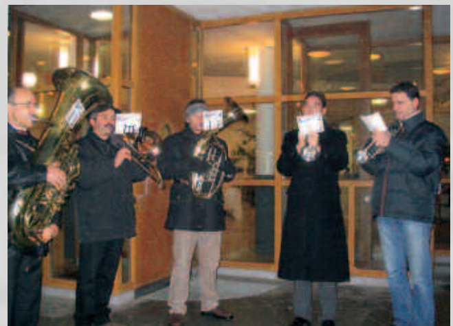
Wie jedes Jahr hat eine Bläsergruppe am Adventmarkt und am Heiligen Abend vor und in der Kirche musiziert.