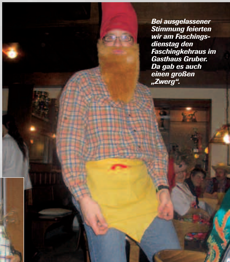
Bei ausgelassener Stimmung feierten wir am Faschingsdienstag den Faschingkehraus im Gasthaus Gruber. Da gab es auch einen großen „Zwerg“.