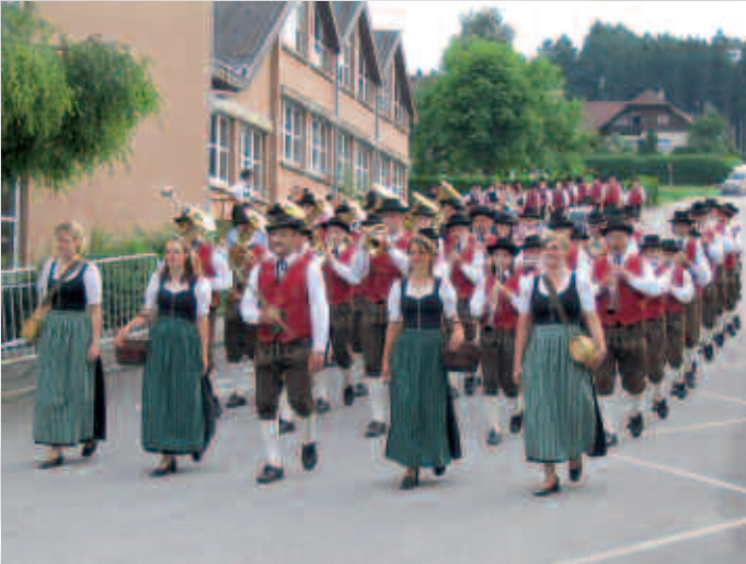
Wie jedes Jahr traten wir Ende Juni zur Marschbewertung an. Wir konnten wieder einen ausgezeichneten Erfolg erreichen.