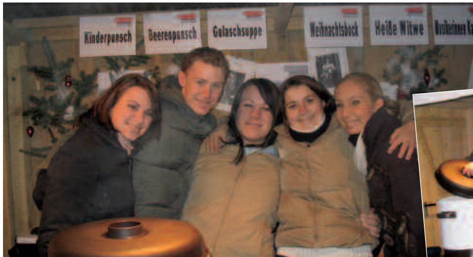
Beim Adventmarkt machte auch die Musik-Jugend ein Standl.