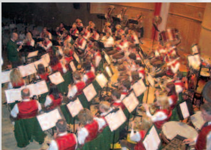
Anlässlich 50 Jahre Staatsvertrag gaben wir beim Österreich-Konzert nur Werke von österreichischen Komponisten zum Besten.