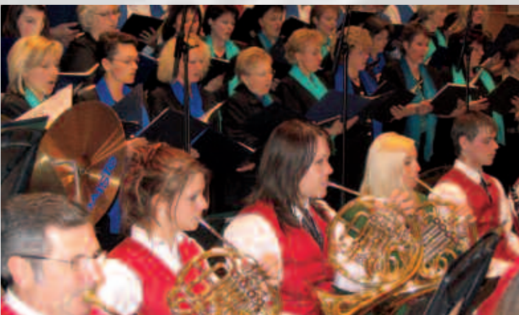
Der Höhepunkt der Herbstsaison war wie jedes Jahr das Herbstkonzert. Zusammen mit dem Singkreis Gunskirchen veranstalteten wir ein Benefizkonzert zugunsten der Erdbebenopfer in Pakistan.