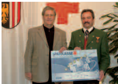
Spendenübergabe an das Rote Kreuz.

Am 1. Adventsonntag fand bei großer Besucheranzahl unser Herbstkonzert unter der Mitgestaltung des Singkreises Gunskirchen statt. Nachdem 2005 ein von