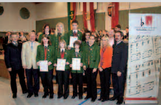
Die geprüften Musiker bei der Verleihung der Urkunden.

Wir möchten allen Jungmusikern nochmals sehr herzlich gratulieren und hoffen, dass ihnen ihre Freude am Musizieren auch weiterhin erhalten bleibt!